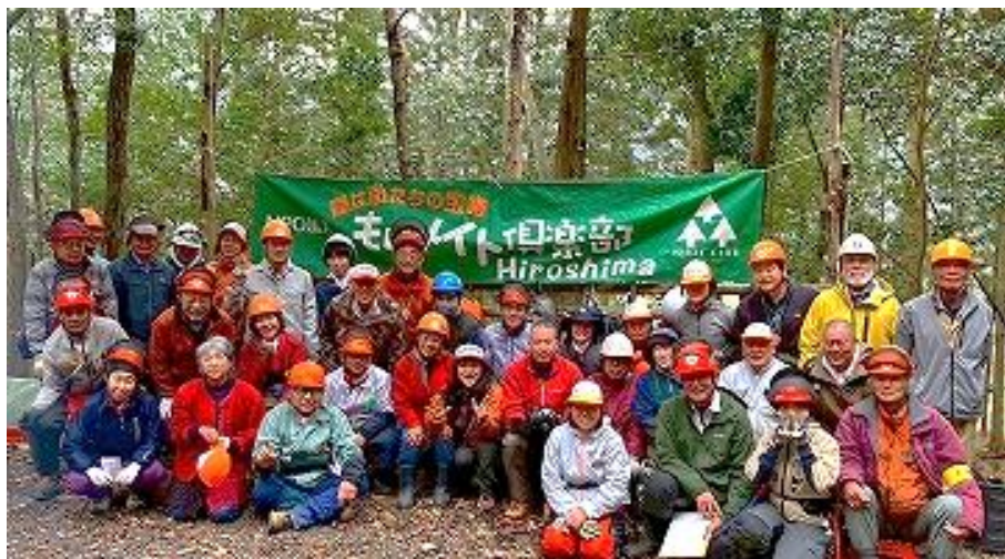
それぞれの研修は充実した学びのひと時に。終えてホッとひと息つきました。

早咲きの桜も咲き始め光は明るさを増し、春の訪れが感じられる当日、天気は午後から雨予報でしたが空も味方して、仕事日和に！