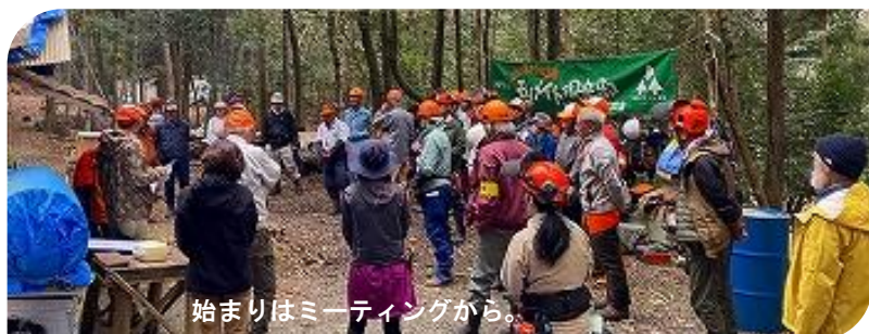
始まりはミーティングから。