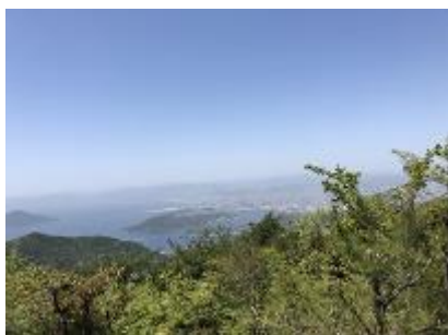
絵下山からの眺め。絶景！