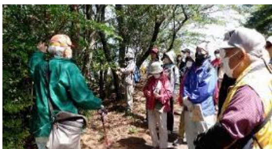
自然観察会にて説明

自宅から近くの間でありながら絵下山に登るのは初めてで、これまで訪れなかったことが悔やまれます。散策会には是非また参加したいと思います。次回はお弁当を持って。