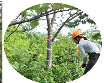
写真は2020年の例会から

～8月例会は、28日の第4日曜に予定しております。詳細は8月号会報にてご案内いたします。～