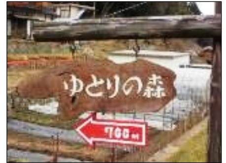
国道69号線道路からの入り口案内板。

誠に残念ですが「ゆとりの森」での例会は延期とし、今後の例会に組み入れ実施していきたいと思っております。